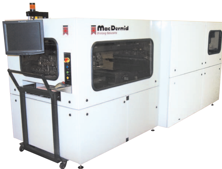
CTP NAPPflex Automatizzato

Se decidete di passare alla tecnologia flessografica, affidatevi alla Società che dichiara "YES, WE CAN". MacDermid